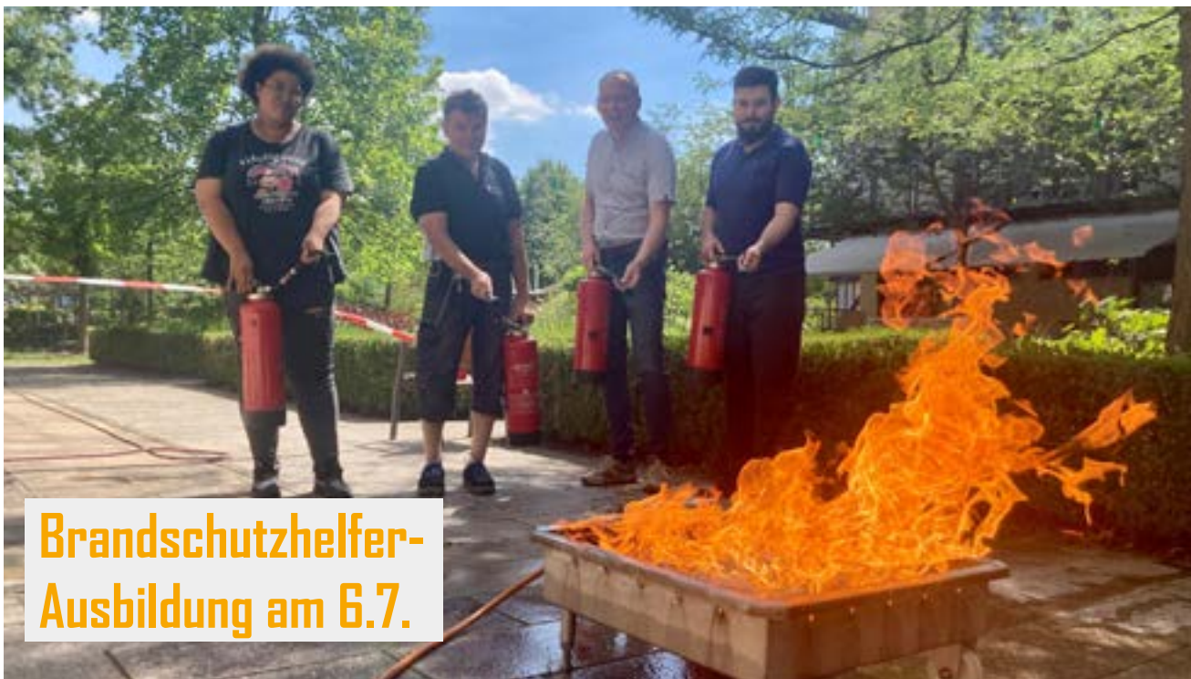
Brandschutzhelfer- Ausbildung am 6.7.